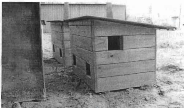
Przykładowe zdjęcie budki dla kotów

żyjących (karmicielom) na podstawie oświadczenia, w którym karmiciel oświadcza, że jest opiekunem kotów wolno żyjących, oraz że wyraża zgodę na przetwarzanie swoich danych osobowych dla potrzeb wynikających z realizacji Programu.