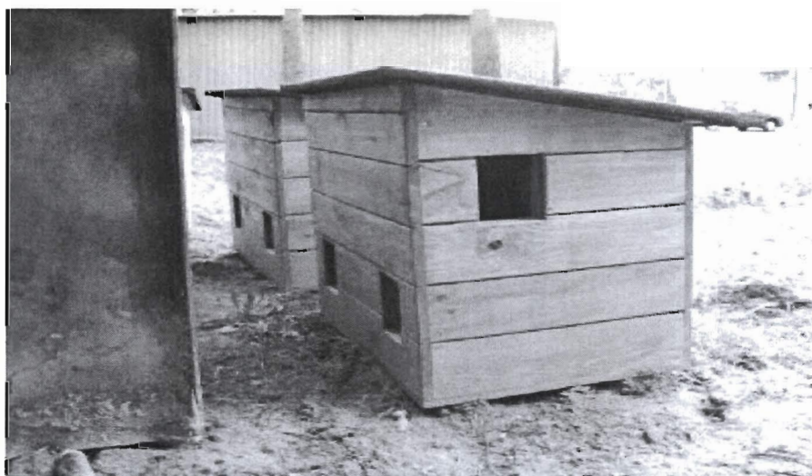
Przykładowe zdjęcie budki dla kotów