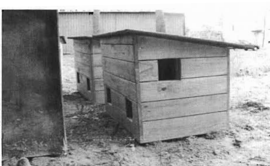
Przykładowe zdjęcie budki dla kotów