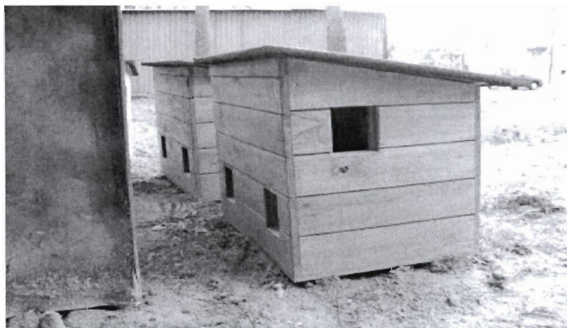
Przykładowe zdjęcie budki dla kotów